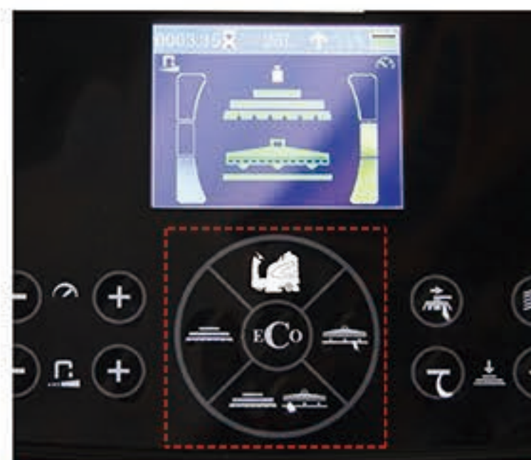
8. 开启清洗模式（上方是行走模式，左边是单吸模式，右边是单吸模式，下方是清洗模式，中间是ECO模式）