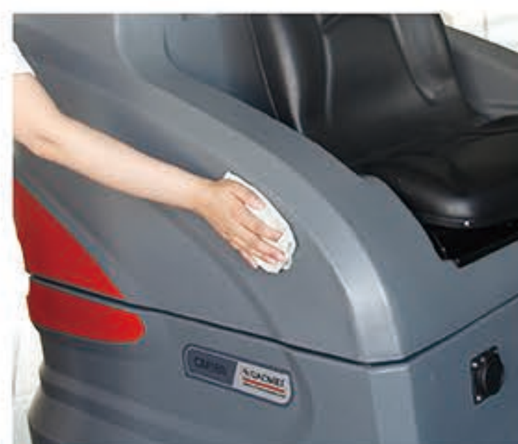
8. 用微湿的干净抹布清洁机身