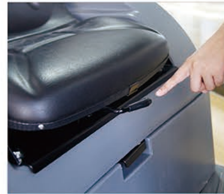
4. 调整好座椅位置，达到最佳的操作舒适度