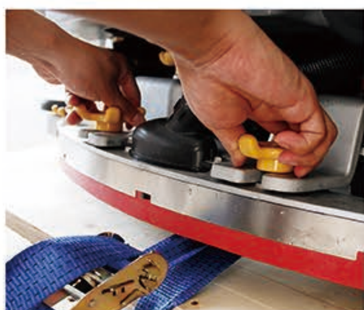
7. 如图拧开螺丝，卸下吸水扒，冲洗干净，并风干