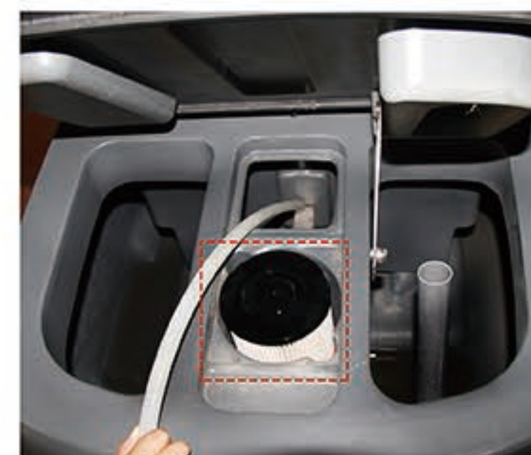
4. 冲洗污水箱及污水感应器罩，并检查污水感应器是否有异物（红色区域内严禁冲洗，避免损坏马达）