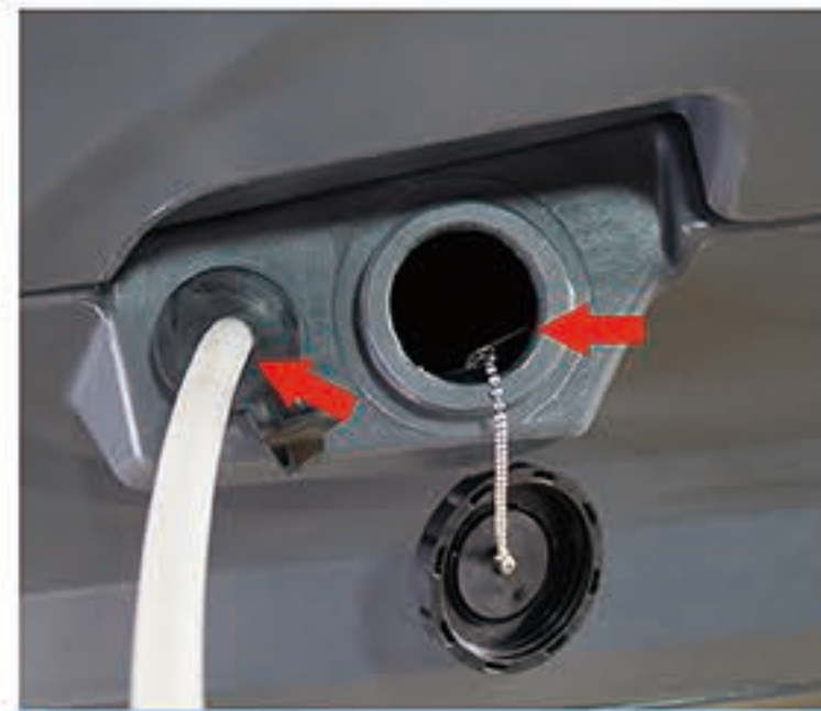
3. 注入清水；如果地面脏污严重，加入适量清洁剂，污水箱加入适量消泡剂（不使用清洁剂的情况下可省略此步骤）