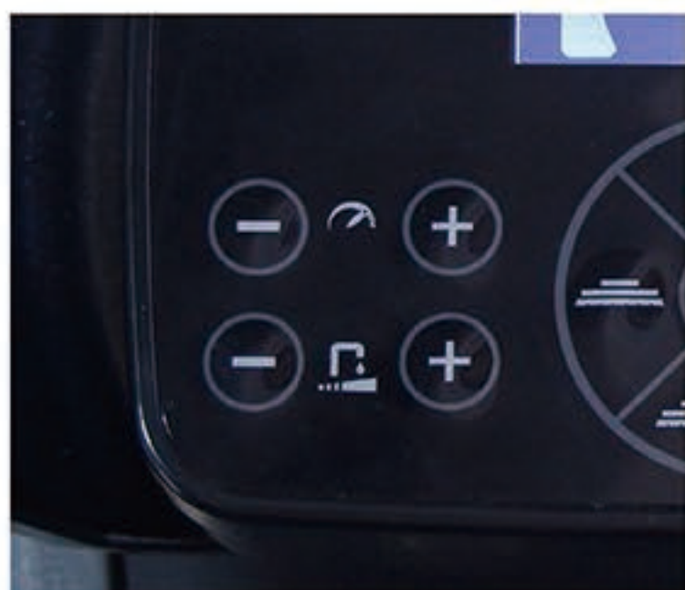
7. 调整好行驶速度 调整好水量大小