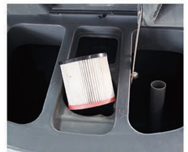
5. 检查污水过滤网，污水过滤网如果不干净，用气枪清理干净