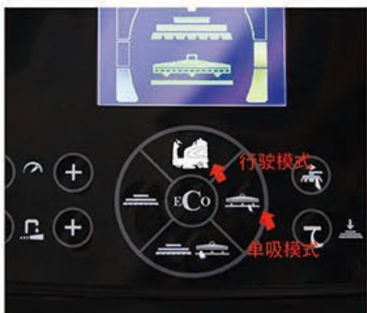
1. 开启单吸模式，继续前进一段距离，回收残留污水。开启行驶模式，升起刷盘和吸水扒。