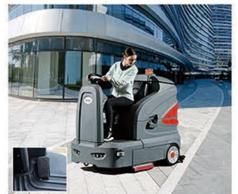
10. 踩动油门踏板，开始清洗工作