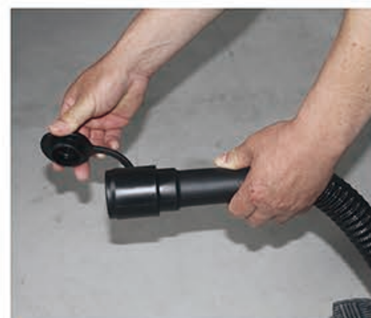
3. 排出污水，清空污水箱