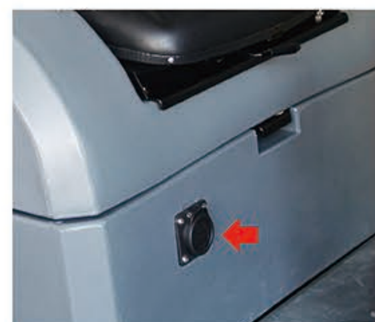
9. 检查充电器接口与机器充电接口是否接好，并连接外部充电器