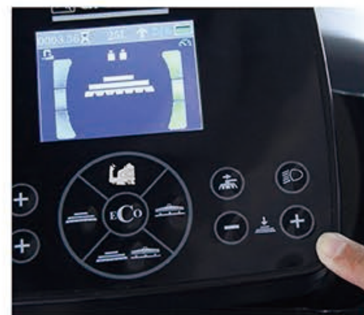
9. 根据地面清洗需要调整好刷盘压力