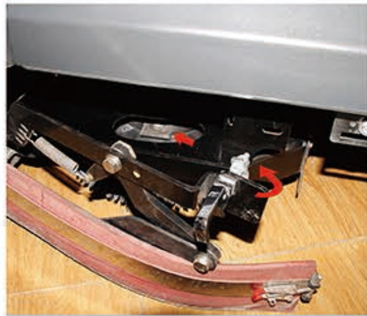
2. 安装刷盘/针座：打开侧门，打开防水侧刮，对准刷扣六边形，拉动把手，卡住即可。安装完毕后，关闭侧刮，旋转拧紧锁扣，对准侧门支架关闭侧门。