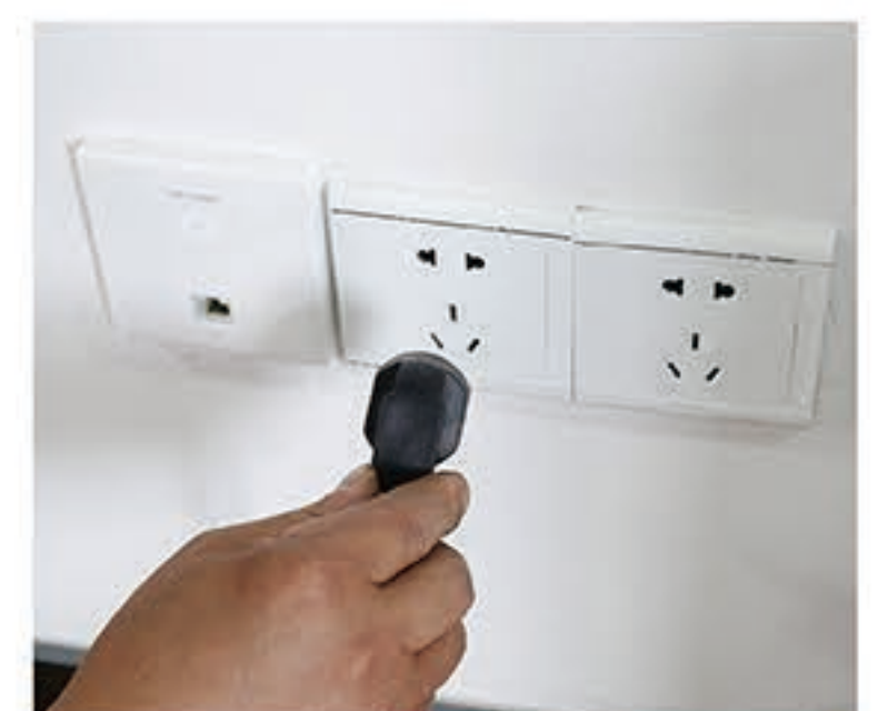
10. 将外部插头插入电源插座及时充电